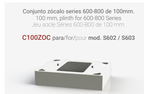
Conjunto zócalo series 600-800 de 100mm. 100 mm, plinth for 600-800 Series Jeu socle Série 600-800 de 100 mm.