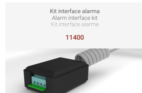
Kit interface alarma Alarm interface kit Kit interface alarme